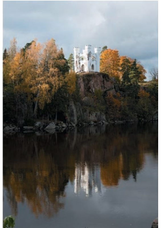
Выделение в парке Монрепо заповедных участков с полным запретом посещения и территорий с его временным прекращением на период производства восстановительных работ