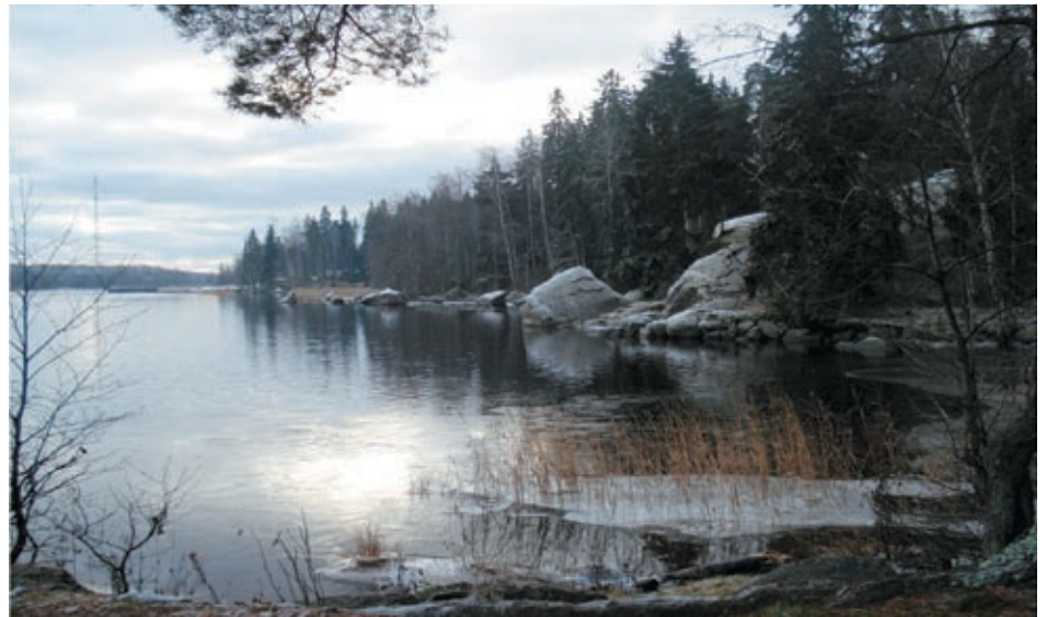
Государственный музей-заповедник «Парк Монрепо». 2012 г.

— Почвенное обследование показало, что происходит усиление антропогенного воздействия и, как следствие, площади деградированных территорий, по сравнению с 1993г, увеличились. Определение фитосанитарного состояния древостоя показало, что его средняя категория — «ослабленная и сильно ослабленная» (таблица 1). Отсюда очевидно, что ситуация не может не вызывать беспокойства и требует срочного вмешательства. Геоботаническое исследование позволило оценить дигрессию напочвенного покрова, результаты которого приведены в таблице 2. Из нее видно, что более трети территории