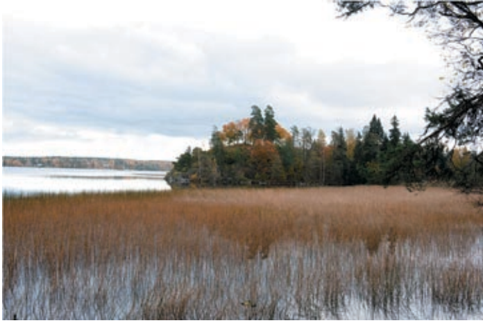
Очистка проток на территории парка Монрепо и бухты Защитная от органического вещества