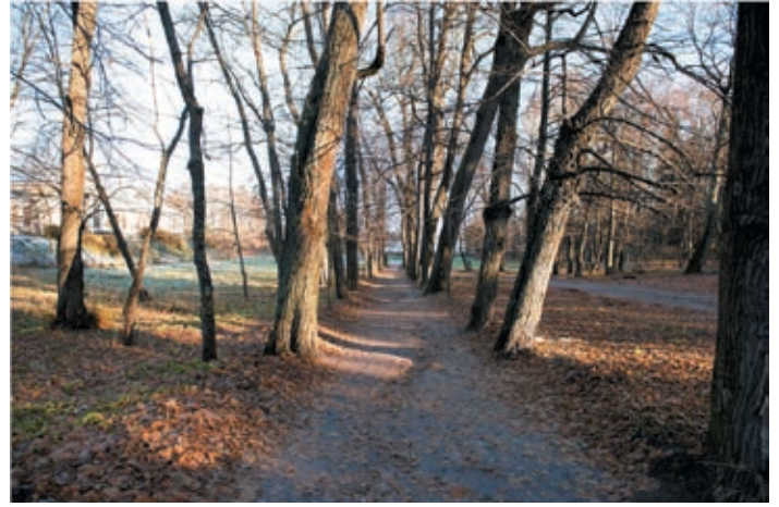
Максимальное использование молодых деревьев из парка для будущего замещения старовозрастных и производства новых посадок

от органических отложений водоемы, вылечим больные деревья, восстановим напочвенный покров и работоспособность дренажной системы. Само по себе это замечательно, но если ничего больше не сделать, то все проблемы парка довольно быстро вернуться. Следовательно, одна из основных задач — это разработка мероприятий, позволяющих контролировать и регулировать антропогенную нагрузку. Фактически речь о том, что она должна более жестко регулироваться. Мы разработали три основных экскурсионных