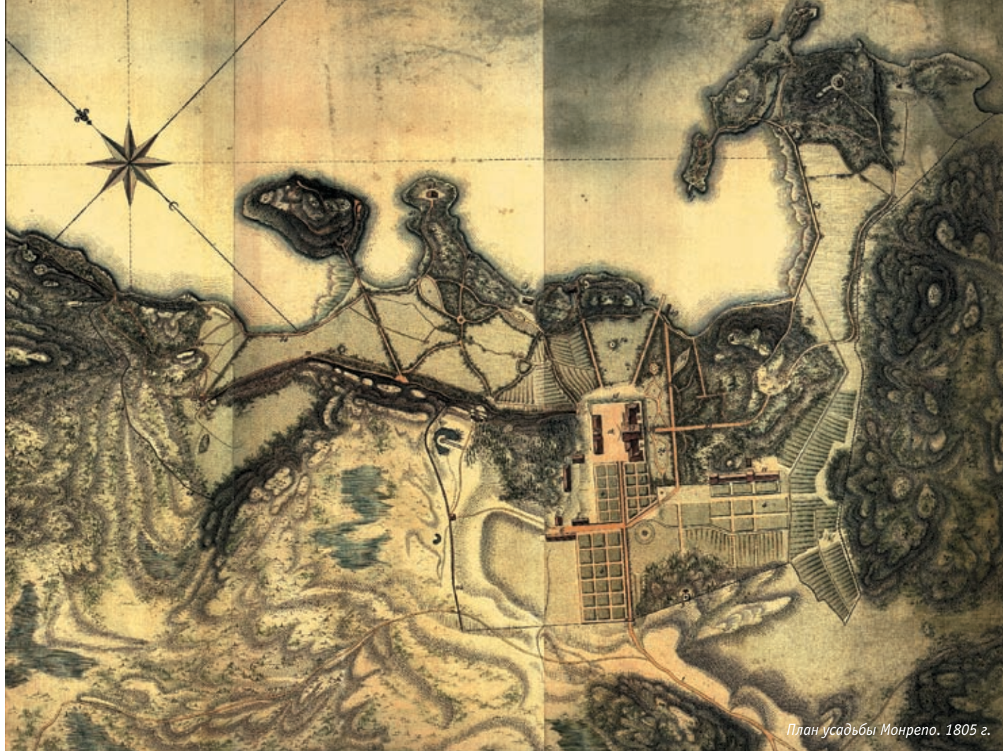
План усадьбы Монрепо. 1805 г.